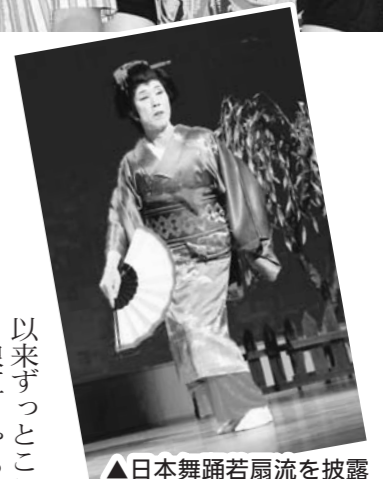
▲日本舞踊若扇流を披露

以来ずつとここにいる。 浪江じゃあ、米を売ったり、珍しい野菜なんかも作って食べたりして。子どもたちには送ってたし、友だちにあげてみんなに喜ばれたりしたなあ。ここに来て野菜買うようになって高くてびっくりした。今はブランドで、きゅうり、トマト、なす、ピーマン、にら、白菜って工夫しながら作ってた。やめつかなと思つても、毎年どん増えちゃった。やっぱり季節の物を朝見るのが楽しみな。それから、平日はゲートボールとグラウンドゴルフをやつた。大会でチームが優勝して新聞にも載つたよ。安達では地元の人に良くしてもらつて有難いし、浪江の人と会うのが一番楽しいな。 仮設では、20年前から続けている日本舞踊を教えて、芸能大会や、夏祭りや秋祭りとかいろんイベントに呼ばれて発表してるのも張り合いあつていいな。人間見られないと進歩しないから、見られることが大事。夜まで復習するから悩む事考え