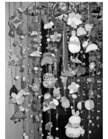
▲君子さん手作りの「つるし雛」で明るい玄関

震災前、私は妻と娘と3人で手芸用品店を営んでいました。店舗兼住宅は、駅前商店街から一本中に入った郵便局の向かい、車の通りは激しくなく、適当に人通りのある良い場所にあります。創業85年、祖父の代からの店ですが、店舗自体は28年前に建て替えたものです。店には、手芸用品だけでなく輸入雑貨なども置き、趣味の店として親しんでもらっていたのとは違います。震災による建物の被害は少なく、商品は雨風にさらされることなく、余り傷んでいません。さりとて、販売もできず、今の住まいに持ち込むには限りがあるので、ほとんどそのままの状態になります。