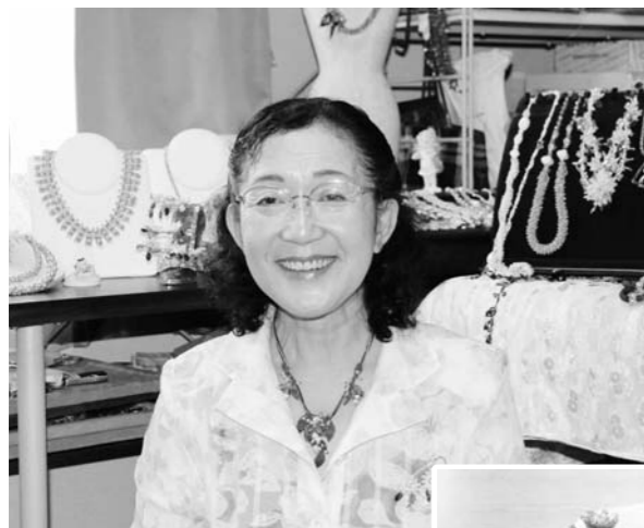
▲手作りのビーズコレクション と一緒に

“自分を耕して、自分に種をまく”をモットーに ～ビーズアートジャパン大賞2013 佳作受賞～