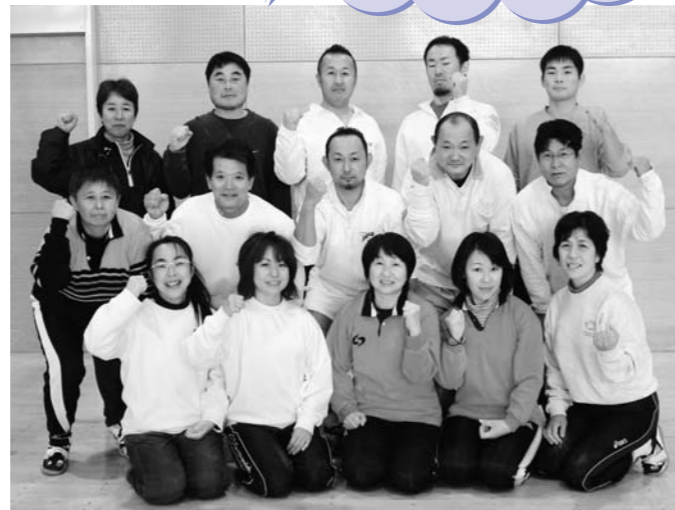
▲マリエンジェルスとスーパーフレンズの皆さん。 「男女一緒に早く浪江の体育館で練習したい！」

—浪江町の皆さんへ— 私たちががんばっています。 何か自分の趣味をみつけて、 一歩でも外に出てみませんか。 綱引きに興味のある方、お 待ちしています。