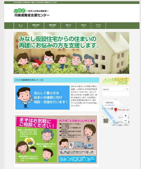
いわて内陸避難者支援センター ホームページ

「いわて内陸避難者支援センター」では、みなし仮設住宅から恒久住宅への移行に向けた相談・支援や生活再建に必要な各種制度の紹介、福祉サービス利用に向けた支援等を行っています。