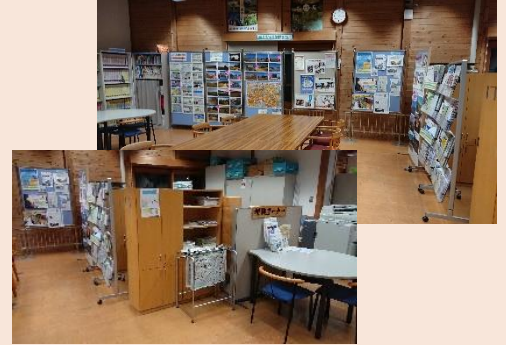
福島県県外避難者相談センター (遊学舎内)

震災直後から秋田への避難者の支援を継続して行っており、生活再建や帰還に向けた情報提供、相談対応を行う窓口となっています。2016 年度からは福島県の「生活再建支援拠点」（全国 26 か所設置）のひとつにもなり、秋田県における広域避難者支援の拠点となっています。