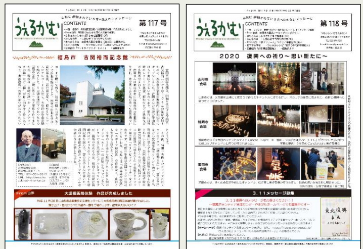
避難者向けフリーペーパー「うえるかむ」

また、「復興ボランティア支援センター」のホームページや山形の避難者向けのサイト「つながろうNET」による情報発信、避難者定住サポート窓口での定住に関する相談業務なども行っています。