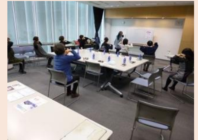
健康サロン交流会 (盛岡市、2020 年 2 月)

2019 年度は、秋田県内のほか青森市、盛岡市、北上市などで交流会を計 7 回開催しました。