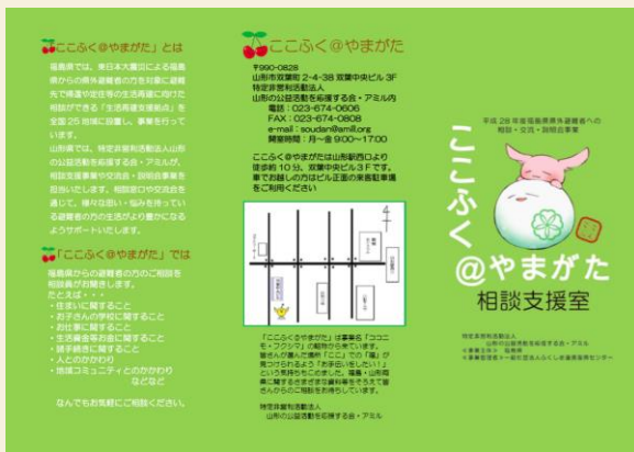
「ここふく@やまがた」リーフレット

また、山形への避難者からの帰還や生活再建に向けた相談受付（来所、電話、メール）を行っています。以前は住宅や生活に関する相談がメインでしたが、最近は相談内容が多様化してきています。すでに山形に住民票を移した方から、避難に由来する課題に関する相談をいただくことも出てきました。