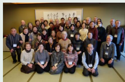
2020/2/12 宮城・茨城広域交流会