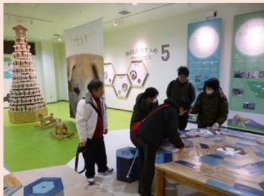
秋田犬を訪ねて交流会バスツアー (大館市、2020 年 2 月)