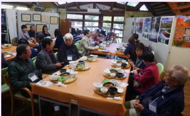
那須交流会（11月6日）の様子

11月に開催した「栃木県にお住まいの皆さんと交流しましょう」では、栃木県那須町の道の駅に、那須地域に避難されている方と宮城にお住まいの方が集まって、昼食会を行いました。