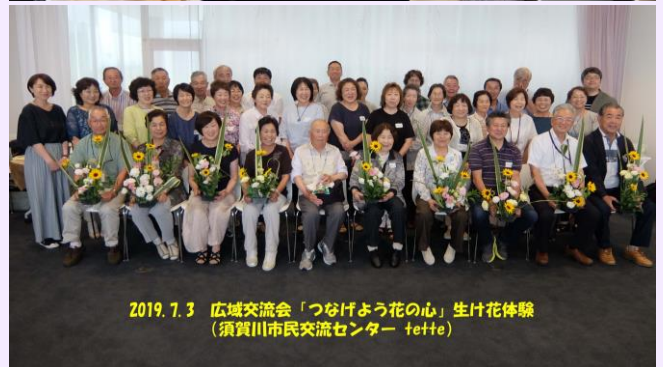
2019.7.3 広域交流会「つなげよう花の心」生け花体験 (須賀川市民交流センター tette)