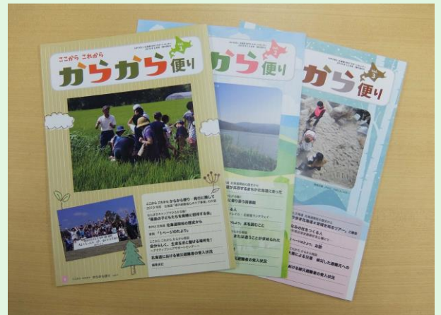
情報紙「ここから これから からから便り」