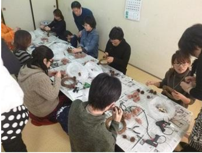
講師の先生方が、一つ一つ

つの材料の紹介や、作り方のポイントなど丁寧に説明してくださり、早速リース作りに取り掛かりました ✨ 松ぼっくりをワイヤーで固定したり、ホットボンドでプリザーブドフラワーを付けたりと、先生方の丁寧なご指導のもと、ママさん達も真剣な眼差しでリースを作り上げていきました 🎵