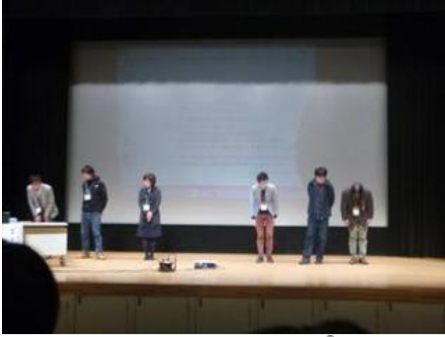
アドバイザーの方々の挨拶👋

分科会では多賀城市、気仙沼市で活動されている支援員の方々と共にアドバイザーの方も交えてそれぞれの団体の27年度の活動報告と「コミュニティ形成支援」というテーマで情報共有などを行いました。