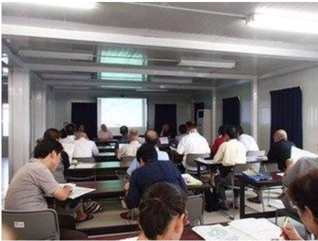
[第2回野蒜復興部の様子]

過去記事 = 野蒜復興部、各班ともに元気に活動開始しました！ (2012/8/3)