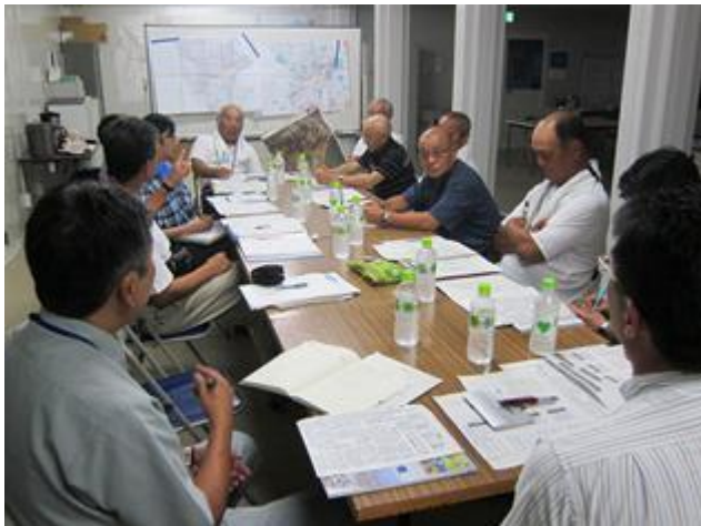
[復興班での議論の様子]

また、行政に対する批判ではなく、みんなで提案をして行こうという姿勢は、「市民協働のまちづくり」に取り組んできた東松島市の力だと感じます。