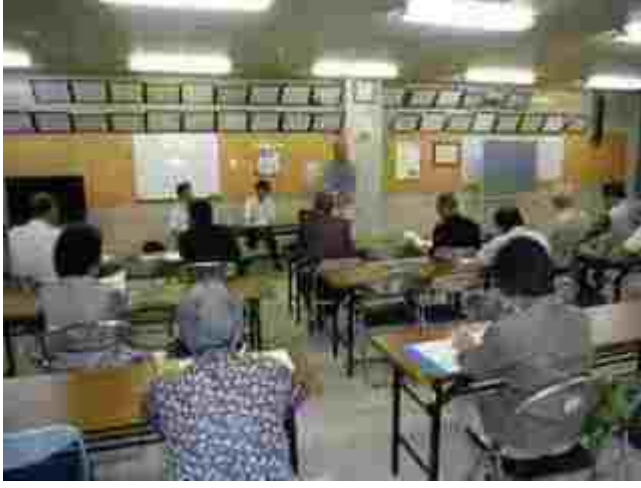
大曲地区 グループでの話し合い