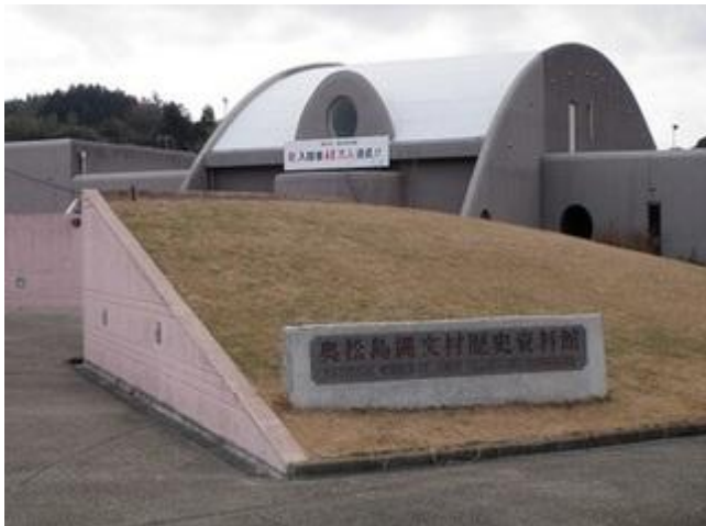
【奥松島縄文歴史資料館】