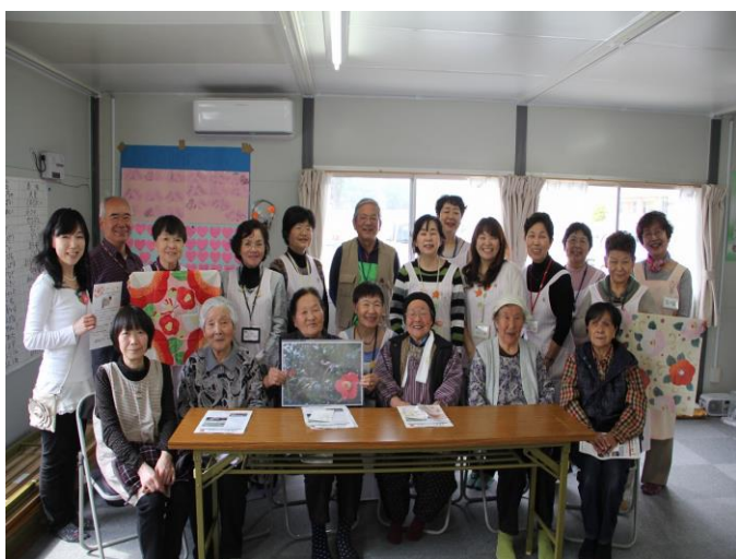
(参加者が揃って記念撮影＝戸倉中仮設住宅集会所)

今年度はこれらの支援を活かして、次のような事業を行います。①これから災害公営住宅に入居される方に対して、情報提供や顔合わせ等を行う事前交流会を開催します。②入居が進む災害公営住宅について、自治会の設立をお手伝いし、自治活動への助成を行います。③これまで別々に話し合いを行ってきた災害公営の方と防集の方が一緒のコミュニティ活動ができるような場づくりをします。④お茶会や種拾い・植樹といった「椿のまちづくり活動」はこれまで通り継続します。⑤新しいまちづくりの動きについて取材・発信する「復興まちづくり通信」の発行も継続します。